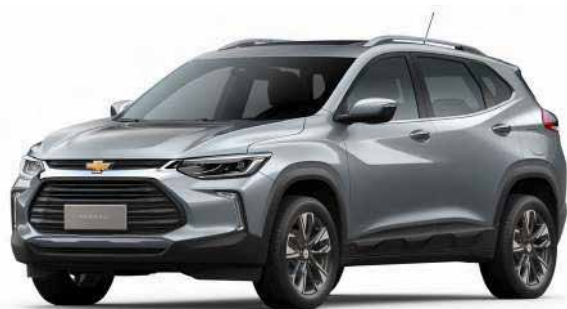
SATIN STEEL GREY