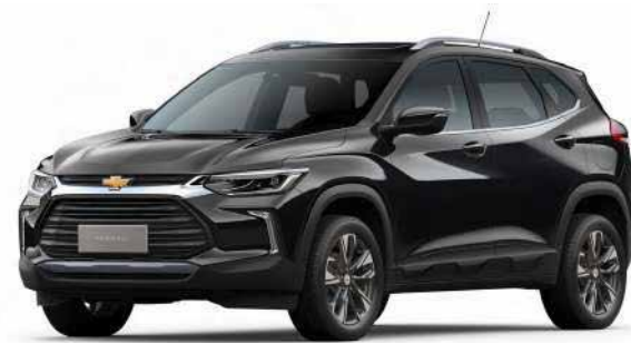
BLACK MEET KETTLE