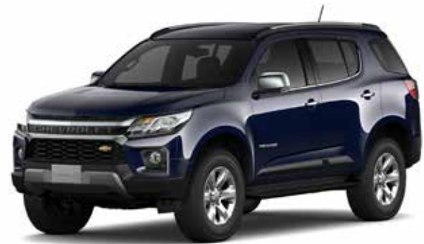
DARK MOON BLUE