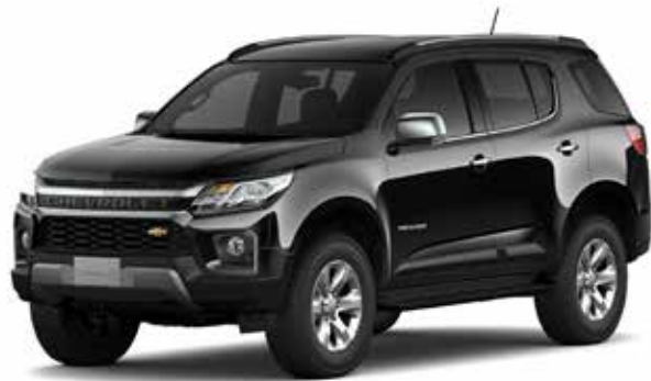
BLACK MEET KETTLE