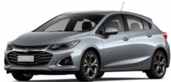
SATIN STEEL GREY