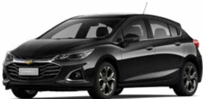
BLACK MEET KETTLE