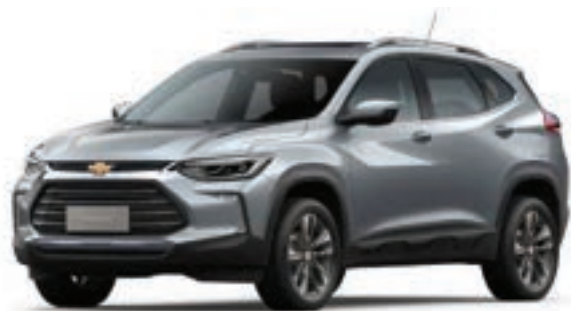
SATIN STEEL GREY