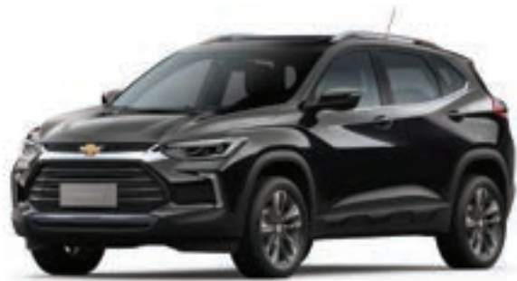
BLACK MEET KETTLE